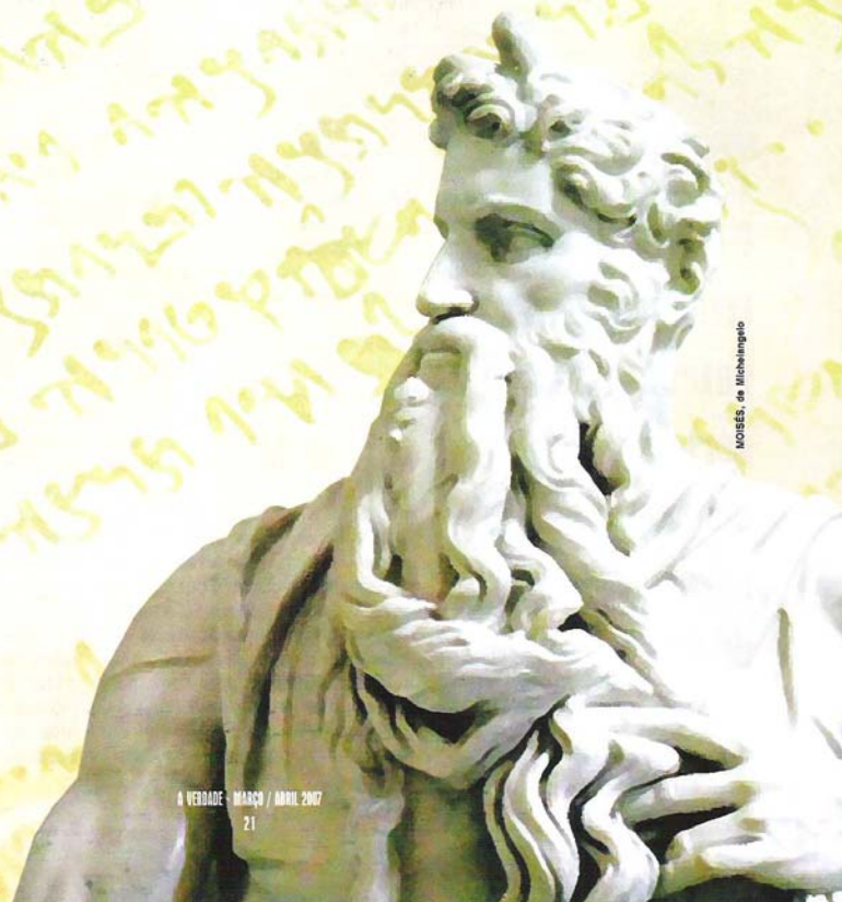
MOISÉS, de Michelangelo

Vale destacar que o estudo foi realizado mediante leitura de capítulos e partes de livros, publicações específicas, sites especializados e também por meio de consultas ao próprio Livro Sagrado e, sendo ela essencialmente de cunho e finalidade histórica, pode apresentar determinadas variações de interpretação, nomenclaturas e/ou ordem cronológica. A investigação está dividida em duas partes: I. Juízes e II. A Guerra dos Amonitas.